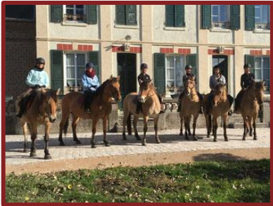
La Ferme équestre Henson de Morlay sur place