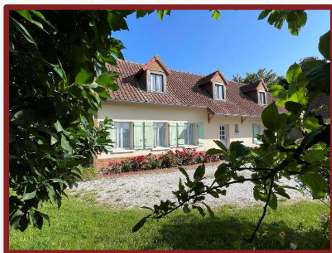
La maison Le Pré des Henson