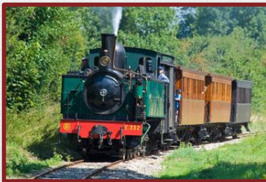
Le Petit Train Touristique à 300 m