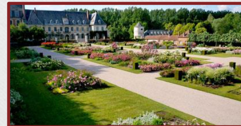
Les Magnifiques Jardins de Valloires à 15 km