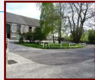
Vue des gîtes