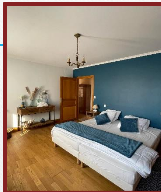
Chambre Bleue PMR