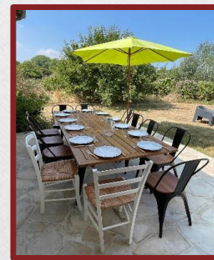
La terrasse et le jardin