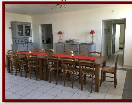
G2 Les Prés Salés