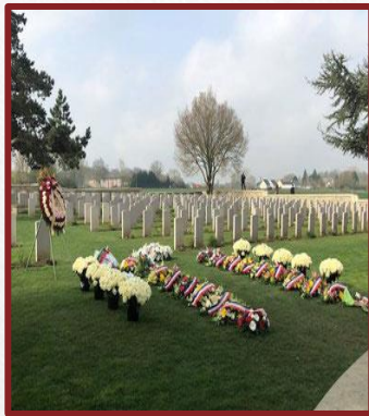
Cimetière chinois de Nolette à 3 km