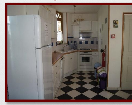
G3 Les Mollières