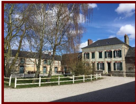
Maison de Maître