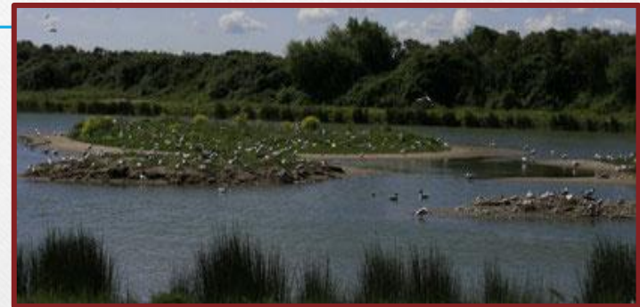
Le parc ornithologique à 12 km