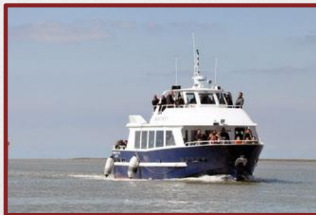
Promenades en bateau avec le Commandant Charcot