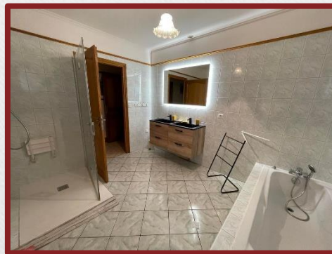
La salle de bain PMR