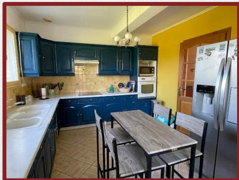
La grande cuisine