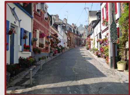
Promenade dans la cité médiévale de Saint Valéry sur Somme