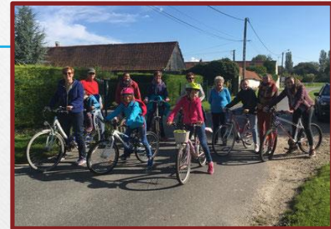
Sortie Vélo en famille sur les pistes cyclables à 350 m