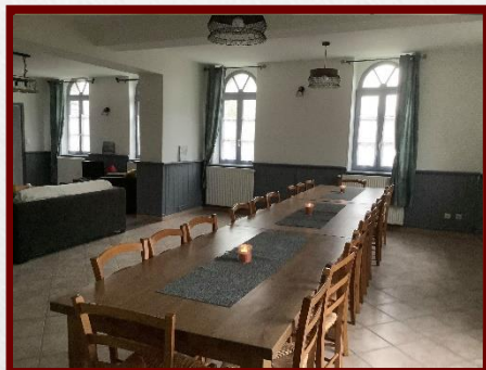
G1 La Baie de Somme