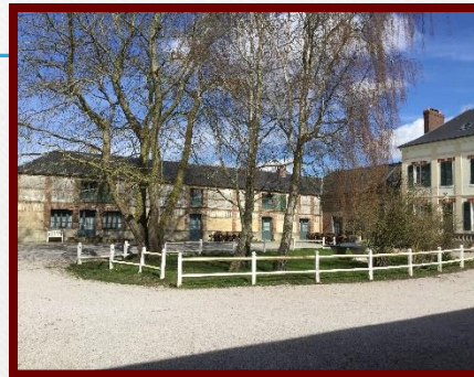
Vue sur les gîtes